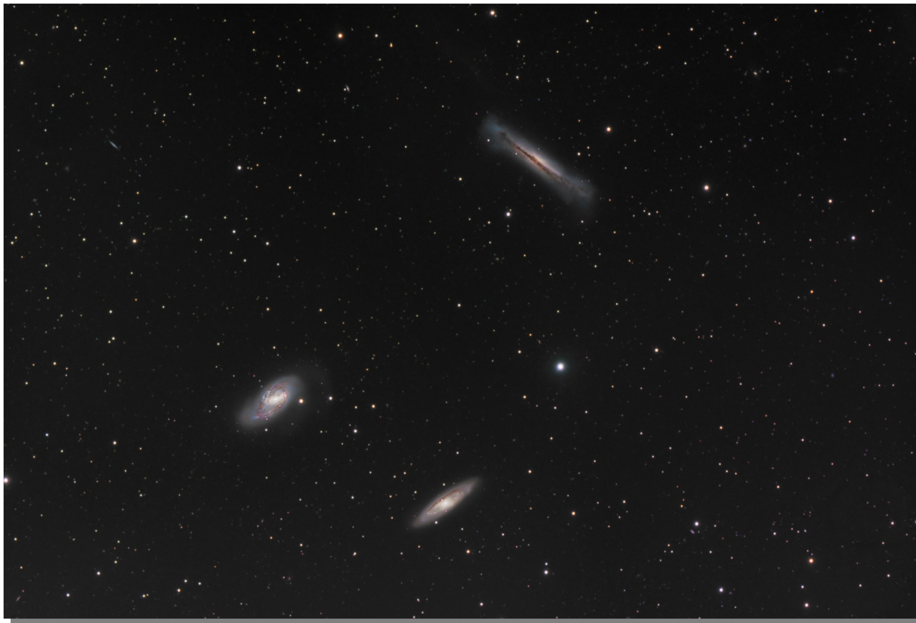
TRIO DE GALAXIES NGC 3628, M 65 & M 66 (Lion)