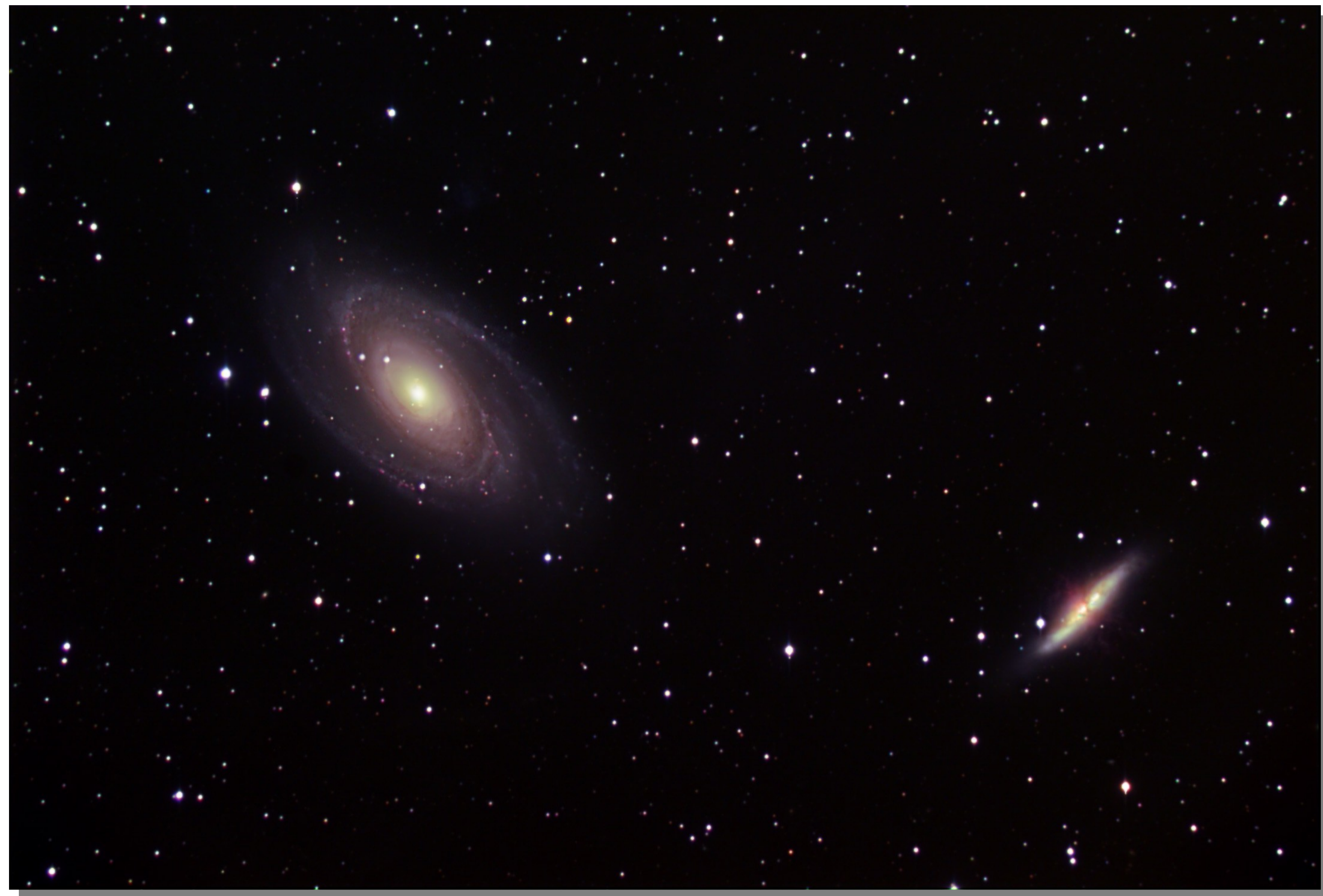
GALAXIES MESSIER 81 & MESSIER 82 (Grande Ourse)