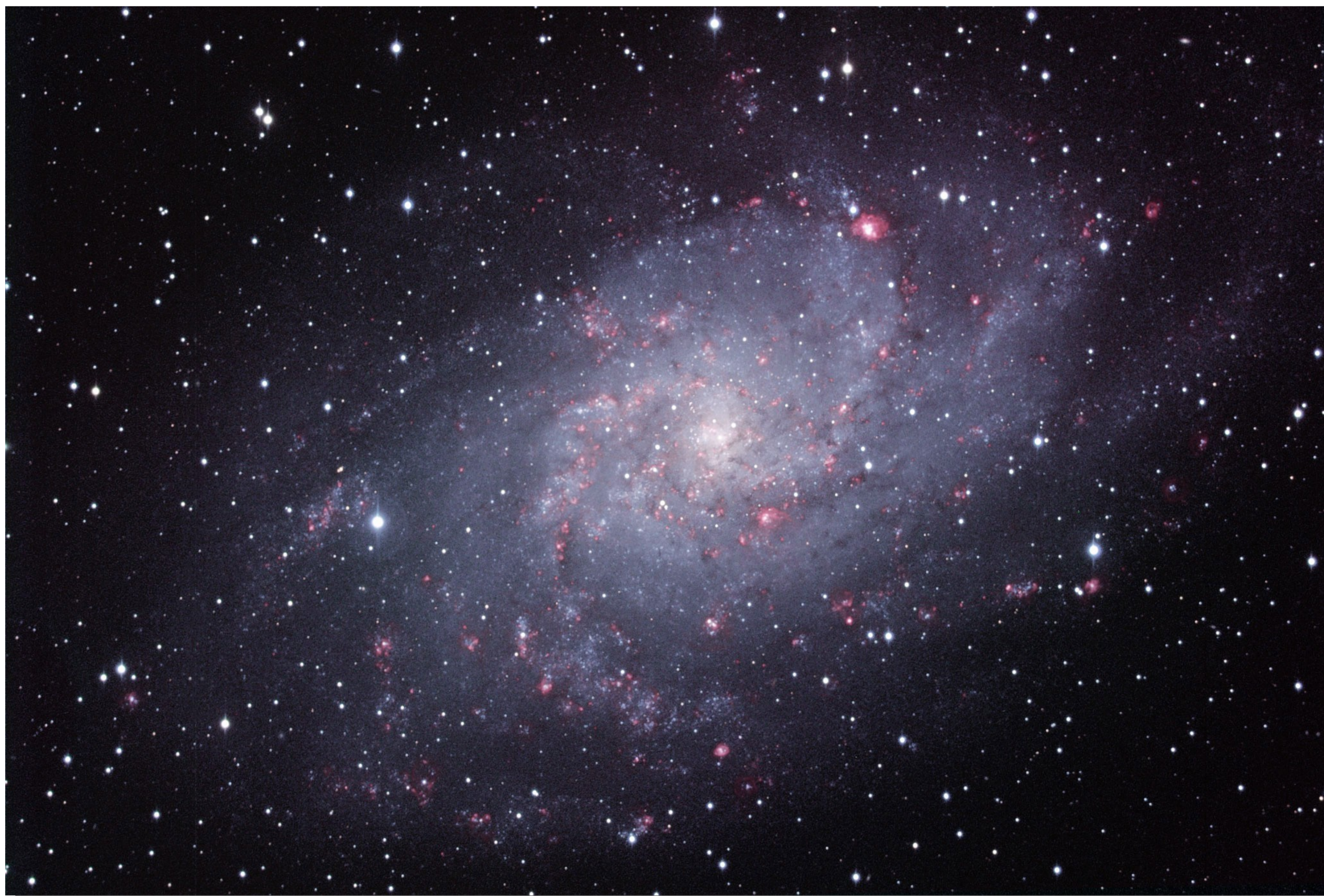
GALAXIE MESSIER 33 (Triangle)