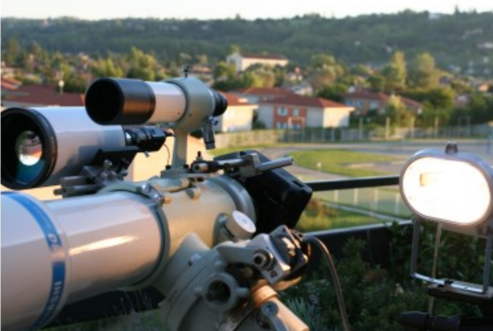
Acquisition des plaques de lumière uniforme (Bats) afin d'enlever le vignettage des images.