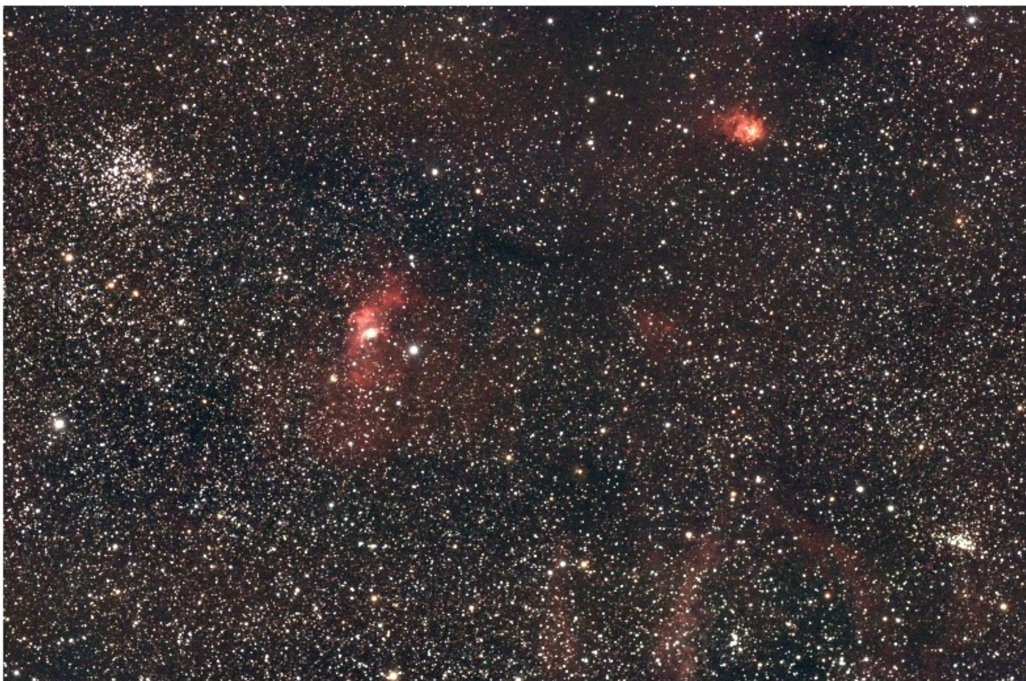
Champ de NGC 7635 (la nébuleuse de la Bulle dans la constellation de Cassiopée)