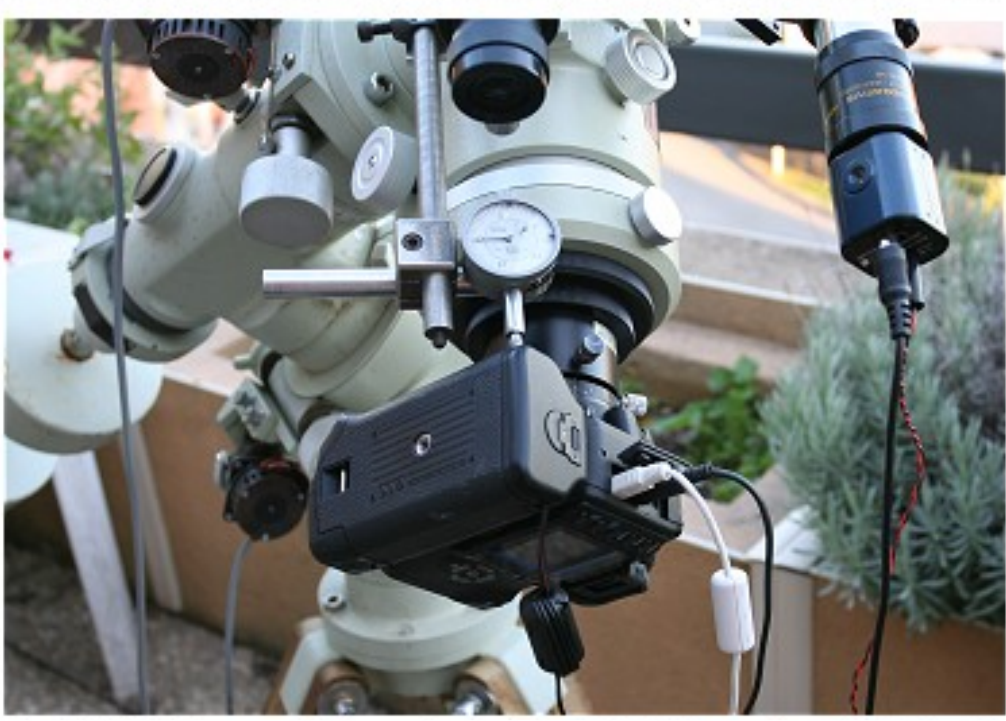
L'appareil photo numérique et son système de contrôle à distance