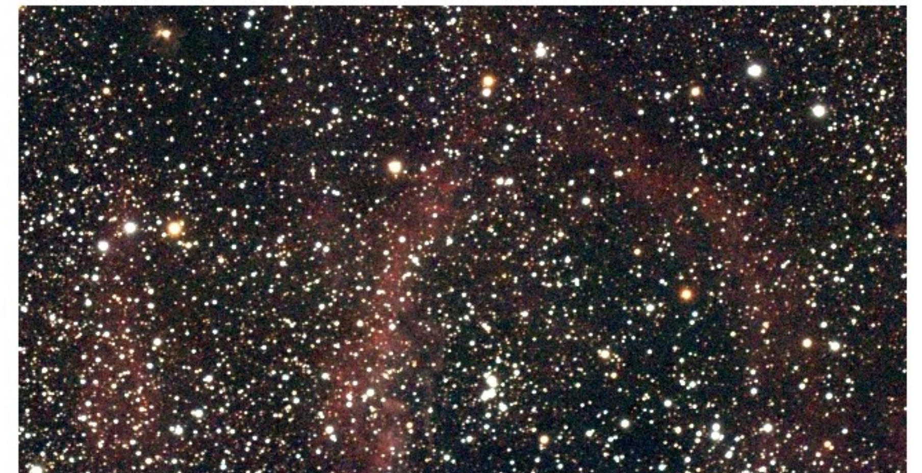
Part of SH2-157 (x 0.5)