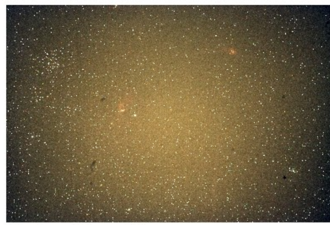
Une seule image RAW de 600 secondes de pose