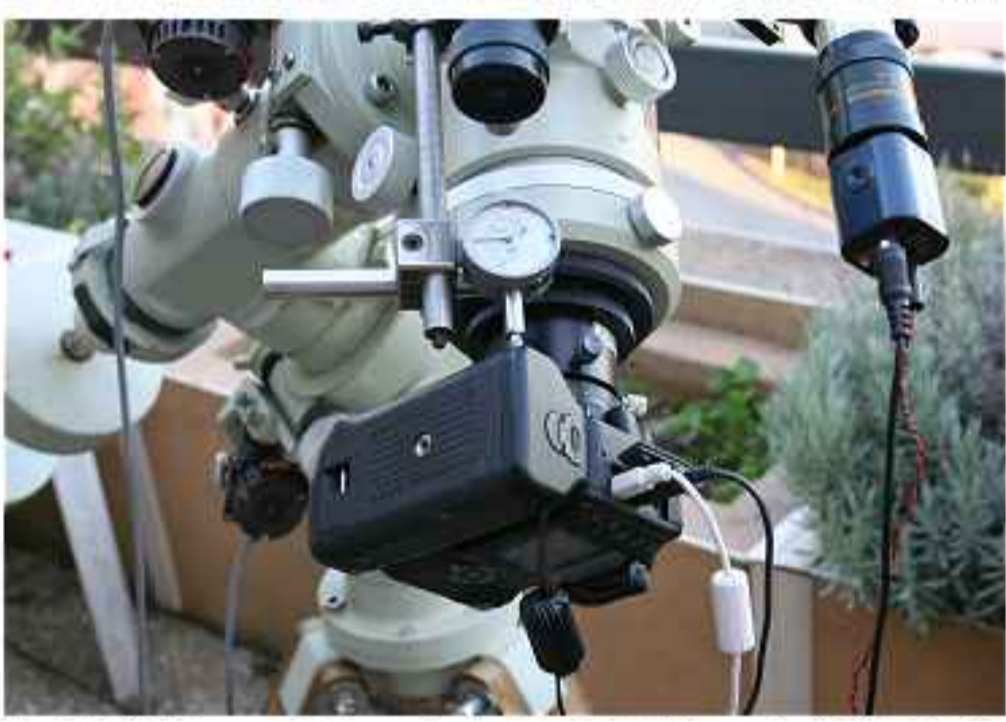
L'appareil photo numérique et son système de contrôle à distance