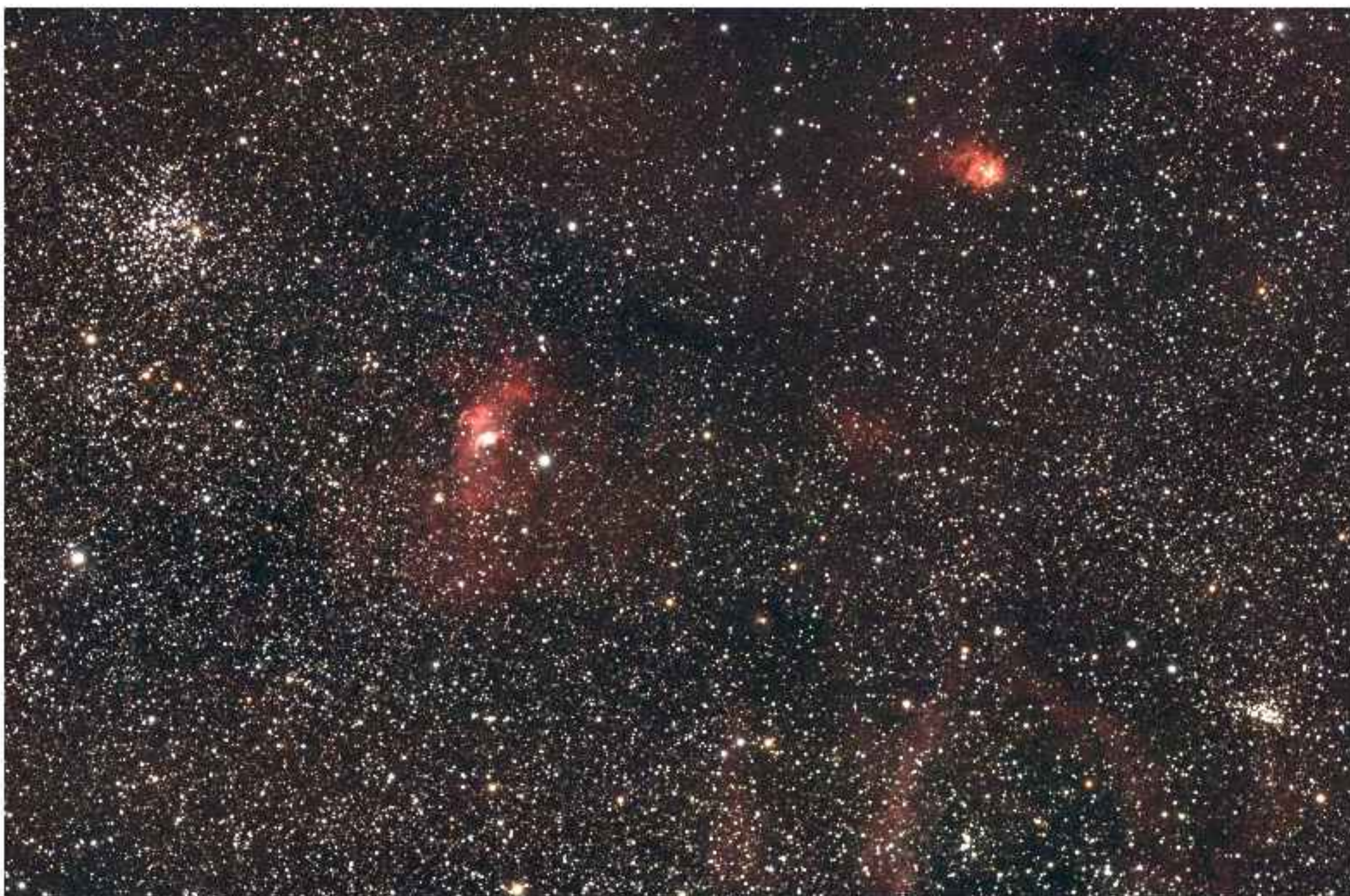
Champ de NGC 7635 (la nébuleuse de la Bulle dans la constellation de Cassiopée)