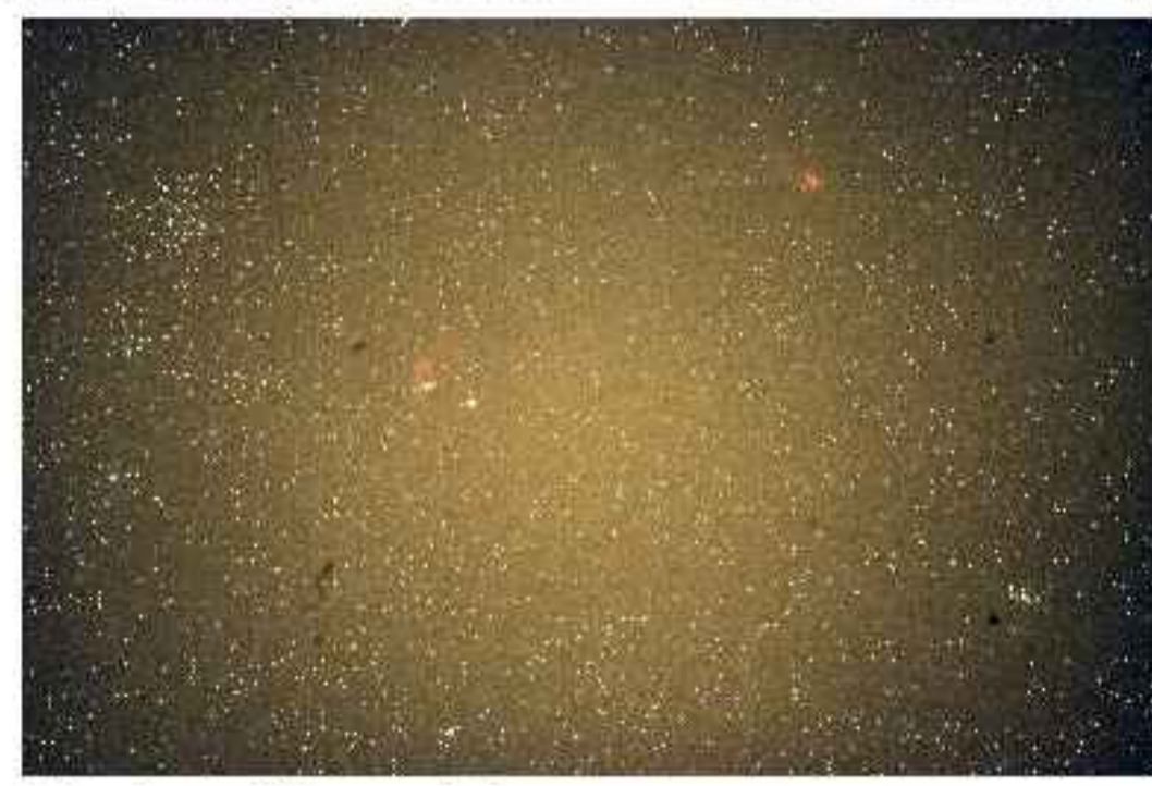
Une seule image RAW de 600 secondes de pose