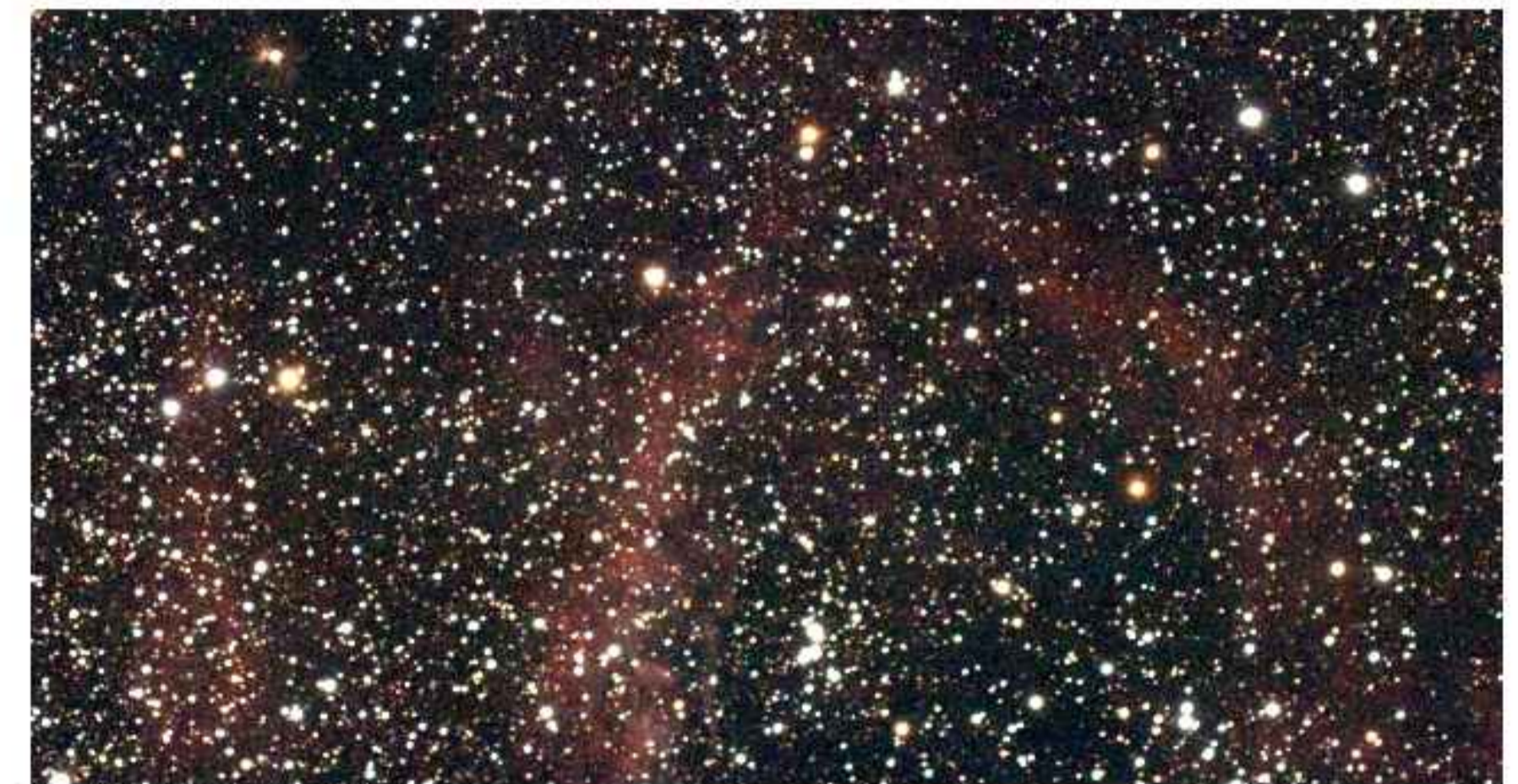
Part of SH2-157 (x 0.5)