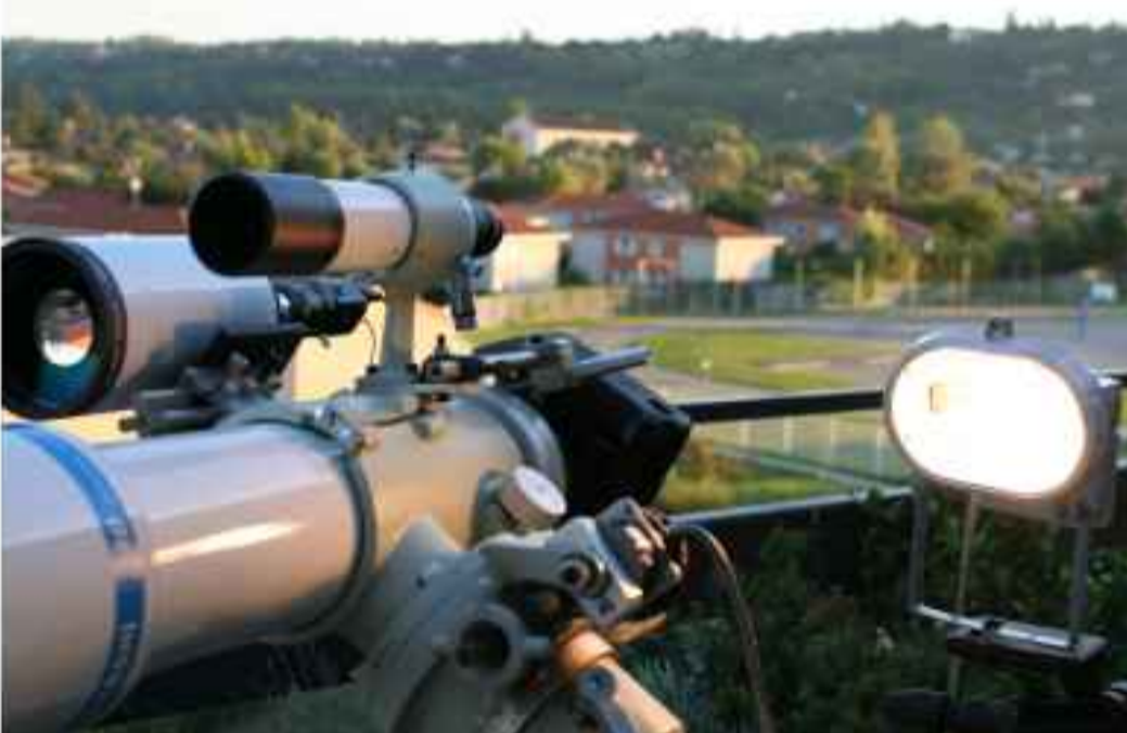
Acquisition des plages de lumière uniforme (Bats) afin d'enlever le vignettage des images.